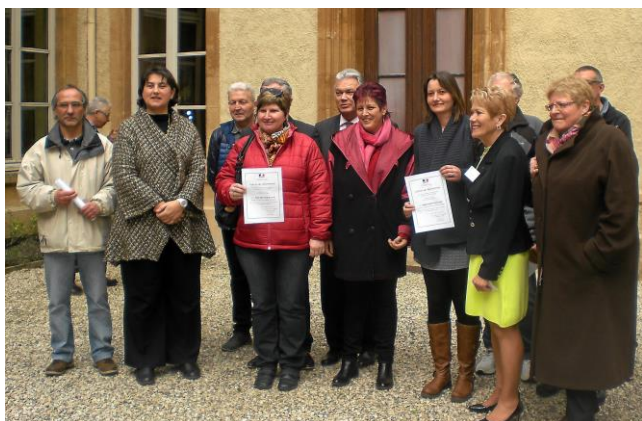
Remise des Lettres de Félicitations en 2016.

La Lettre de Félicitations a été créée le 22 avril 1988. Elle est destinée à récompenser celles et ceux qui ne peuvent prétendre à la Médaille de la jeunesse, des sports et de l'engagement associatif, mais qui se dévouent en faveur de la vie associative. Elle est un témoignage de reconnaissance, dans l'attente éventuelle de l'attribution de la Médaille de Bronze.