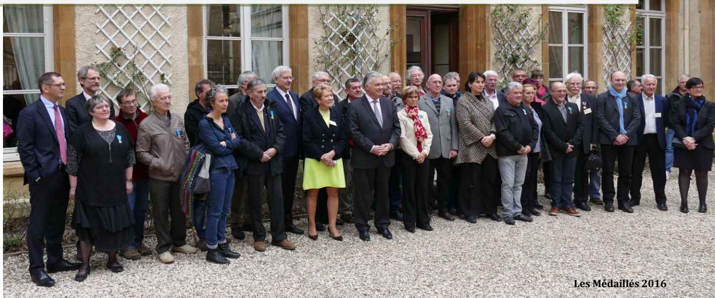
Les Médailleurs 2016

Comité Départemental des Médailleurs de la Jeunesse, des Sports et de l'Engagement Associatif de Lozère