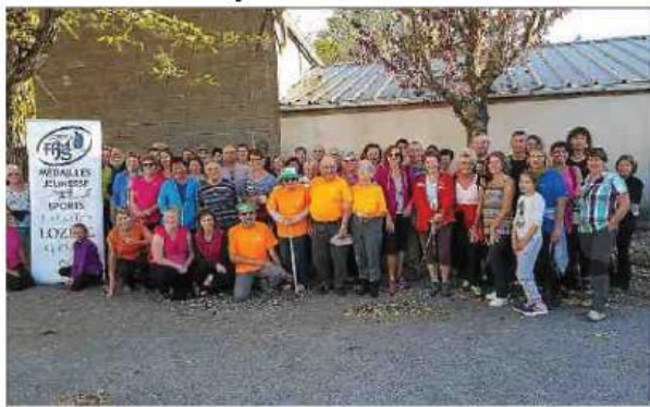
■ La marche pour la vue a connu un beau succès.

Midi Libre | midilibre.fr DIMANCHE 13 NOVEMBRE 2016